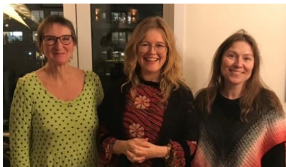
IGAs kvinnesterke sekretariat:

Lokalene benyttes til undervisningsformål, møtevirksomhet, generalforsamling med mer. Fra 12. mars har vi dels leid større lokaler, men det meste av møter og mye undervisning har vært på nett, digital.